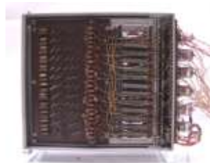
展示品3 電源ユニット

展示品「SENAC-1の概説」には、SENAC-1の開発目的、設計の基本方針、諸元について記載されていたので一部を紹介いたします。ちなみにこの冊子は、全学の利用希望者向けの講演会で使われたようです。