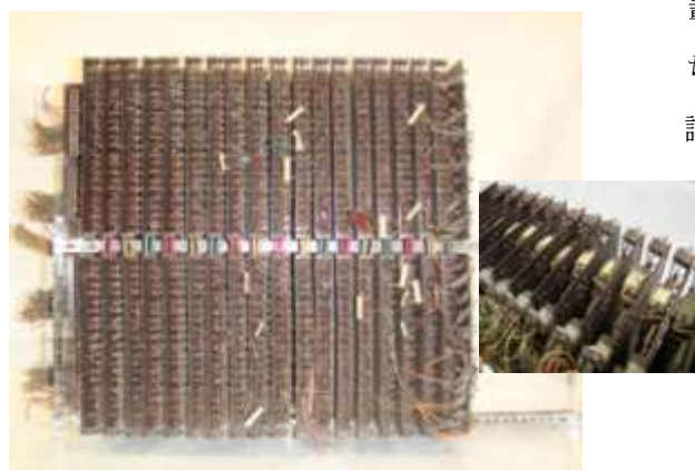
展示品2 パラメトロン演算ユニット

展示室にはSENAC-1の当時の写真、計算機の部品、利用者に向けに作られた印刷物などが展示されています。その中で展示品1は、当時電気通信研究所内の研究室に設置されたときの写真です。展示品2は、その中に組み込まれていたパラメトロン演算ユニット、展示品3は電源ユニットです。