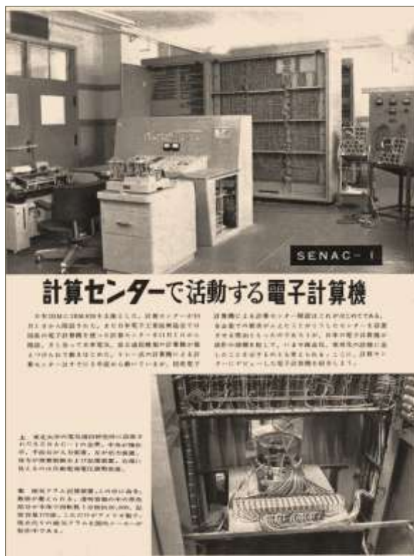
展示品 2 雑誌の記事

書かれており、SENAC-1 の性能、機器構成、利用法、利用可能分野、そしてプログラミングの例が記載されています。紹介されているプログラミング言語は機械語のようです。当時の読者は、この機械語の意味を理解できたのでしょうか。最後に全文を掲載いたしました。この資料から、計算機の構成とその利用環境など、当時の計算機センターの雰囲気を感じていただけたらと思います。他の資料、「SENAC-1 演算制御について」では、演算回路とその制御回路の概略、「SENAC-1 のプログラムについて」では、数値計算を念頭においた機械語によるプログラムと数式の自動プログラムが説明されています。「SENAC-1 の概説」では、開発目的、基本設計、諸元について書かれており、その内容は前回紹介いたしました。ちなみに、機械語という表現は筆者が記したものであり、今回紹介した資料では、見当たりませんでした。多くは Instruction Code、命令、Register、Memory、記憶装置という表現でだけ説明されています。