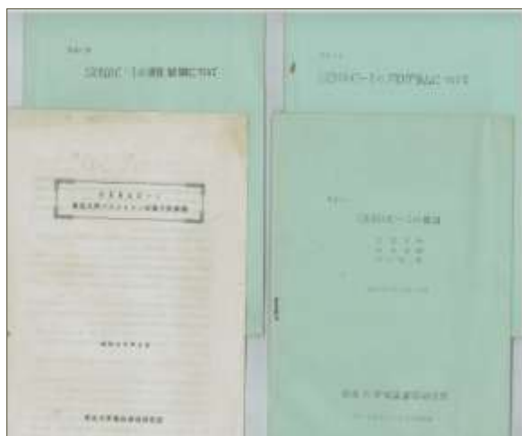
展示品 1 電気通信研究書 発行資料

今回は SENAC-1 に関する印刷物の展示品を紹介いたします。展示品 1 は SENAC-1 を開発した東北大学電気通信研究所が発行した資料です。「SENAC-1 東北大学パラメترون式計算機」は学内への SENAC-1 の広報活動か、啓蒙活動用に作られたものと思われる。内容は読み易く